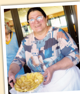
Fabrication de la Tourtière