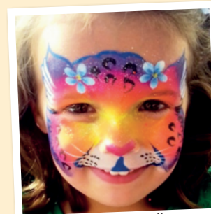
Harmony maquillage 06 47 21 60 82

Les enfants, amenez votre panier décoré, vous aurez une surprise en plus !