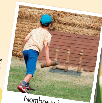
Nombreux jeux traditionnels anciens

Centre Equestre de SIGBELL 05 63 95 25 65 St Beauzeil (82)