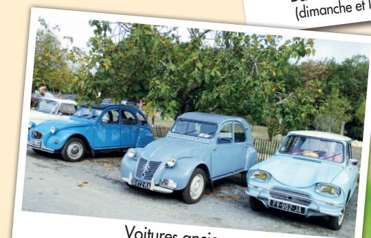
Voitures anciennes «Los Pècs de la Cacumba» (dimanche et lundi)