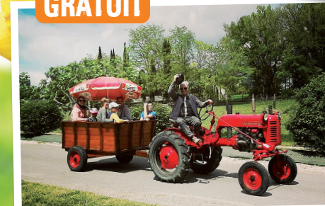
Tours de petit tracteur