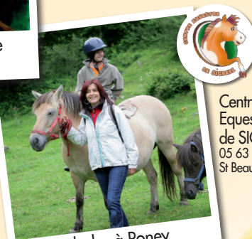
Balades à Poney (dimanche et lundi)