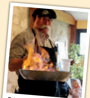
Démo de Foie Gras poêlé

Tables de pique-nique à disposition sous les pruniers ou à l'abri.